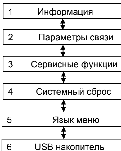
Рисунок 2 – Структура меню режима «Восстановление ПО»

При загрузке терминала в режим «Восстановление ПО» на его дисплее отобразится главное меню, показанное на рисунке 2.