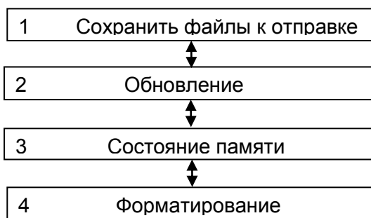
Рисунок 4 – Структура меню режима «USB накопитель»

6.4.3 При переходе в пункт меню USB накопитель на дисплее терминала отображается меню, показанное на рисунке 4.